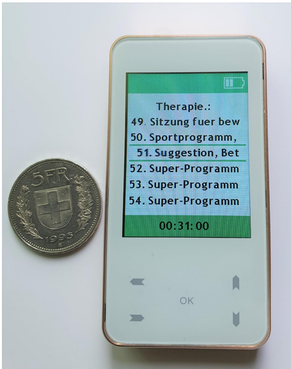
Größenvergleich zu einem 5 Franken Stück!